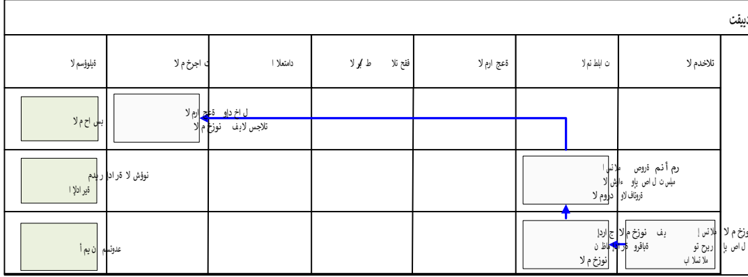
شكل رقم / ٦

يوضح المخطط البياني التالي ( شكل رقم / ٦ ) طريقة تسلسل العمل لتقييد مشتريات المخزون: